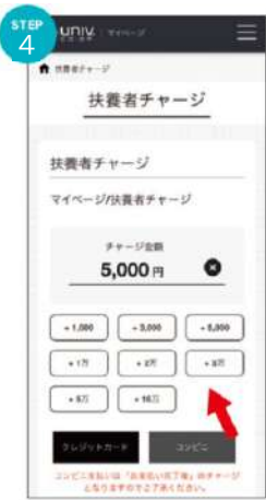
④表示される画面で希望チャージ金額をタップ