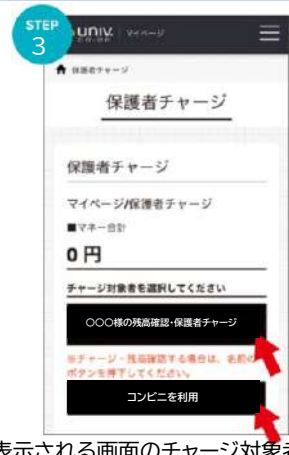
③表示される画面のチャージ対象者をタップして選択し、下の「コンビニを利用」をタップ ※ 対象者を選択後、画面を下にスクロールすると組合員本人の電子マネー残高が表示されます