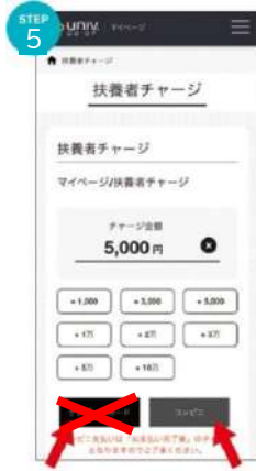
⑤画面下の支払い方法を選択タップ(クレジットは不可)