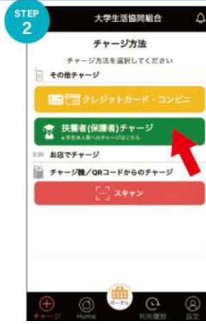
②「扶養者(保護者)チャージ」をタップ