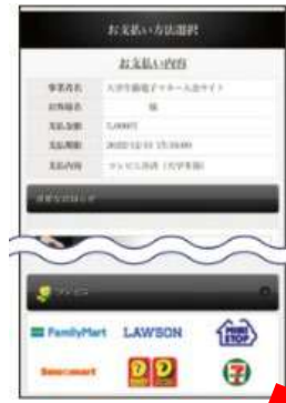
⑧支払いするコンビニ名をタップし、各コンビニでの手続き方法に従ってお支払い