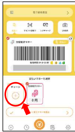
①大学生協アプリを起動し、「チャージ」をタップ