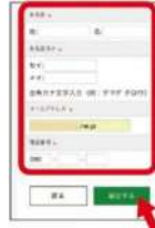
⑥チャージするマネーは「生協電子マネー」を選択し、お名前等必須情報を入力し「確定する」をタップ